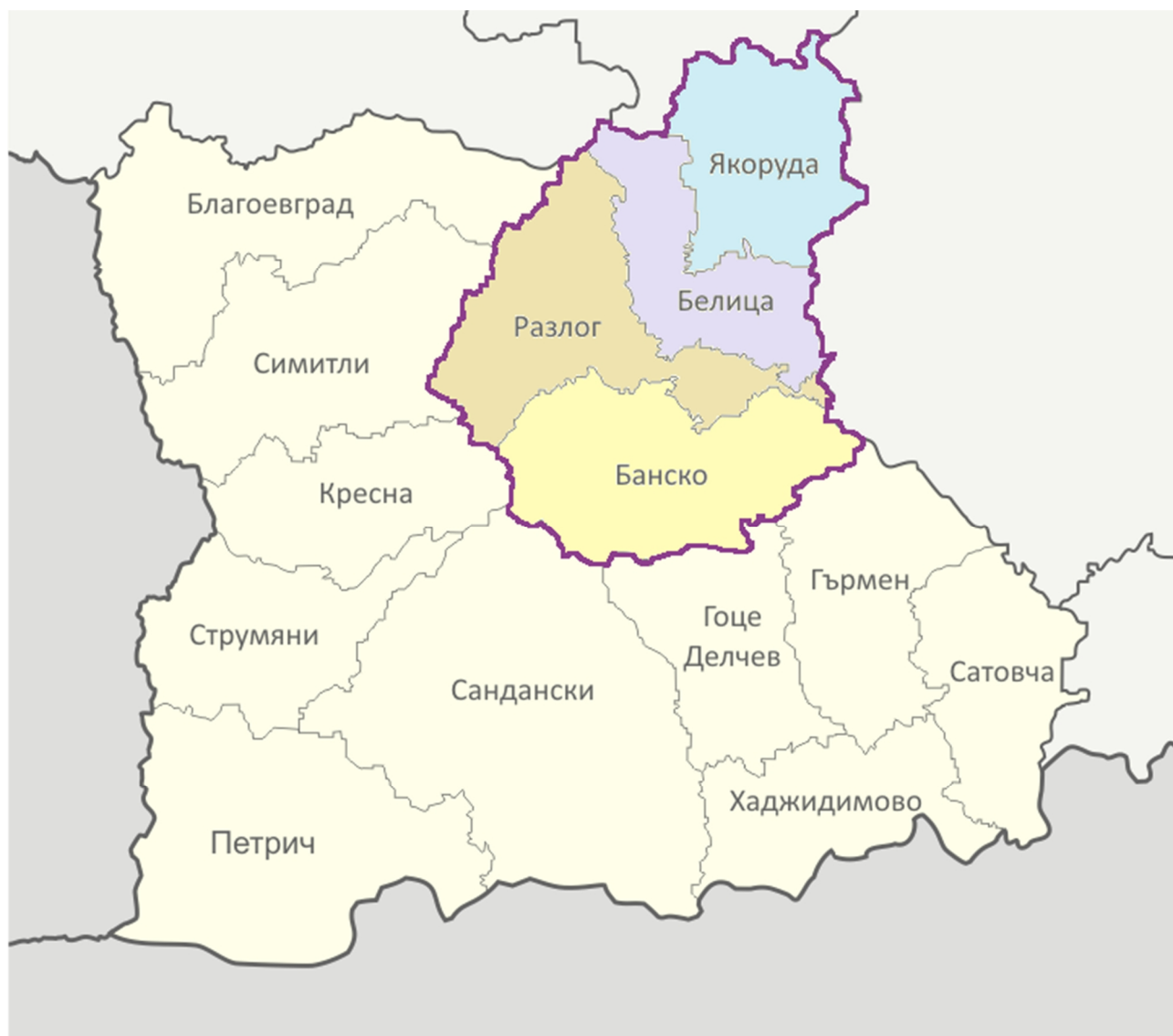
Фигура 1-01: Териториален обхват и граници на регион за управление на отпадъците Разлог